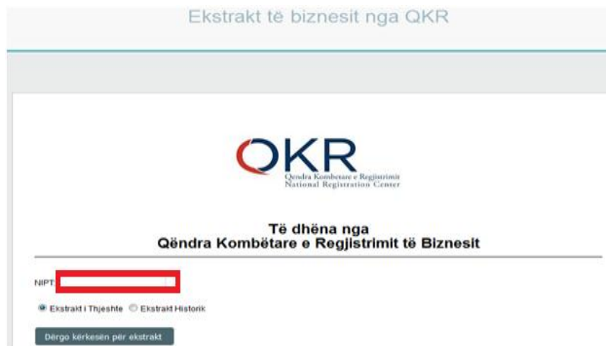
Figura 4. Aplikimi për ekstrakt të nënshkruar.

Pasi keni klikuar butonin “Përdor”, në të djathtë të ekranit tuaj do të shfaqet figura më poshtë. Për me tej, aplikuesi (individ) duhet të vendosë NUIS (NIPT) , te fusha e shënuar me ngjyrë të kuqe (shih Fig. 4) dhe përzgjedhë llojin e ekstraktit që dëshiron (i thjeshtë ose historik).