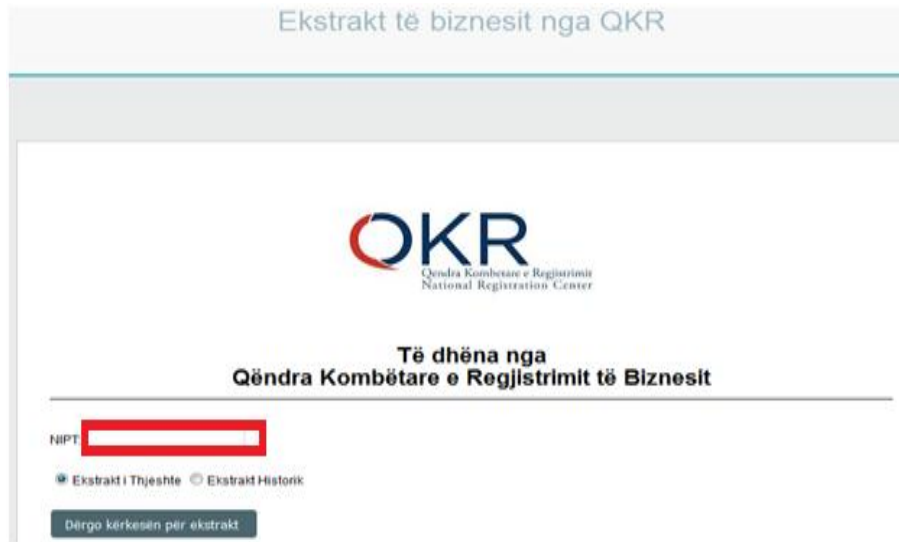
Figura 7. Kërkesë për ekstrakt të nënshkruar(biznes).

Për me tej, aplikuesi duhet të vendosë NIPT (NIPT) , të fusha e shënuar me ngjyrë të kuqe (shih Fig. 7) dhe të përzgjedhë llojin e ekstraktit që dëshiron (i thjeshtë ose historik). Pas kësaj, klikoni butonin “ Dërgo kërkesën për ekstrakt ” dhe ekstrakti i përzgjedhur do t’ju dërgohet i nënshkruar elektronikisht në e-mailin tuaj.