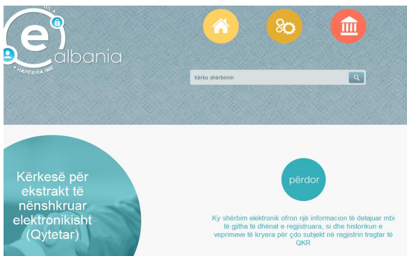
Figura 3. Përdor shërbimin “Kërkesë për ekstrakt të nënshkruar (Qytetar)”

Pasi të keni përzgjedhur shërbimin” “ Kërkesë për ekstrakt të nënshkruar (Qytetar) ”, klikoni butonin “ Përdor ”.