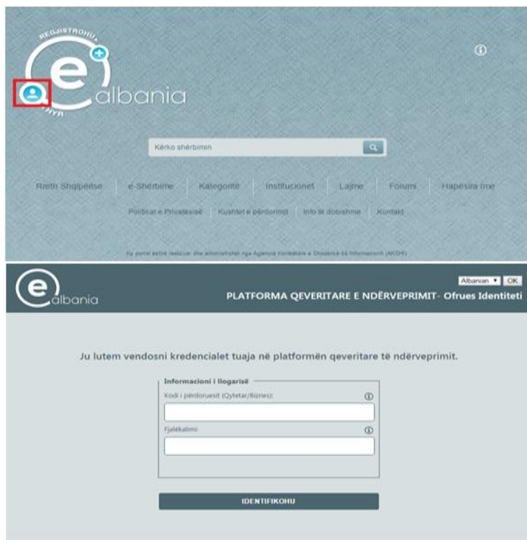
Figura 5. Logimi

Pasi të jeni loguar në portalin e-albania, duhet të përzgjedhë: “Kërkesë për ekstrakt të nënshkruar (Biznes)” , siç tregohet në figurën më poshtë, për të shkarkuar ekstraktet e kërkuara.