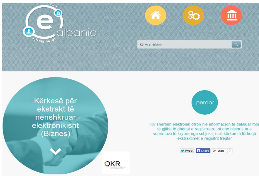
Figura 6. Përdor shërbimin “Kërkesë për ekstrakt të nënshkruar (Biznes)”

Pasi të jeni loguar në portalin e-albania, duhet të përzgjedhë: “Kërkesë për ekstrakt të nënshkruar (Biznes)” , siç tregohet në figurën më poshtë, për të shkarkuar ekstraktet e kërkuara.